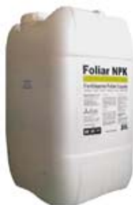
Concentración de N, P 2 O 5 , K 2 O, MgO y S en Foliar NPK expresado en % (p/v)

6 microelementos: Hierro, Manganeseo, Boro, Zinc, Cobre, y Molibdeno (EDTA-quelados.). No contiene en su formulación Cloro ni Sodio.